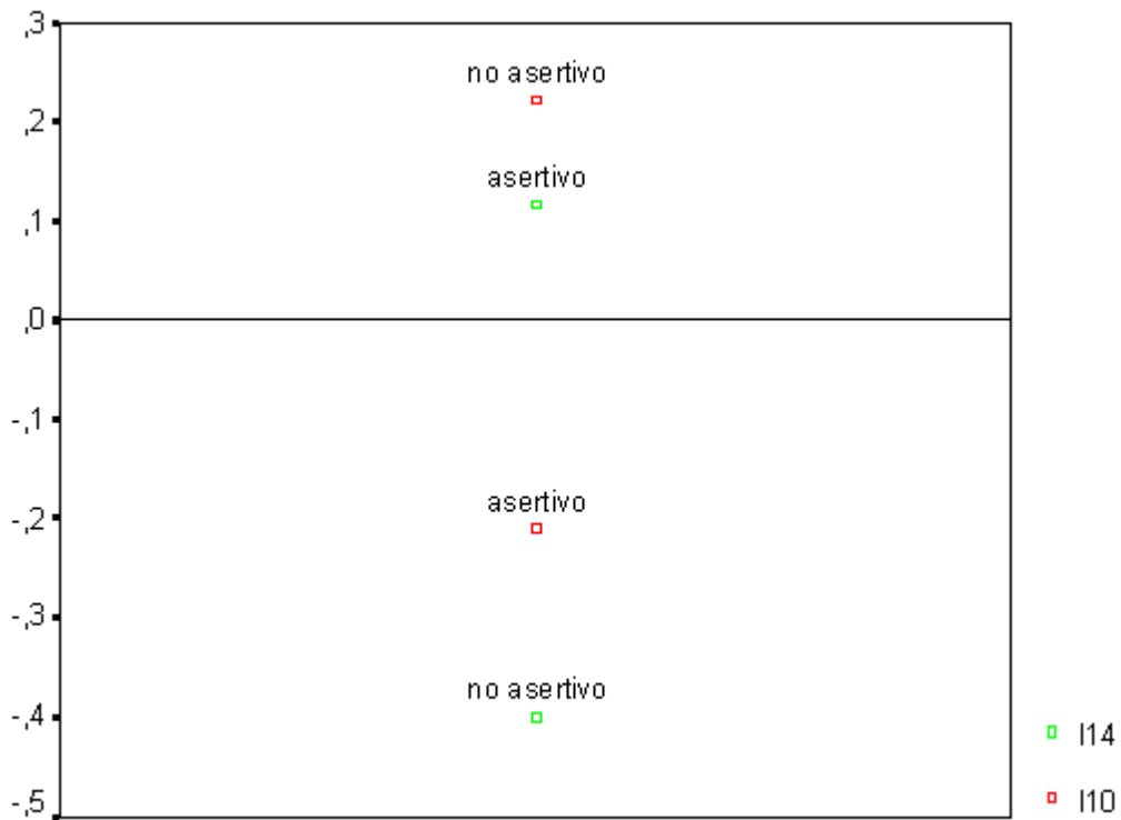
Gráfico 2: Análisis de correspondencias entre los ítems 10 y 14 de la escala tipo I.