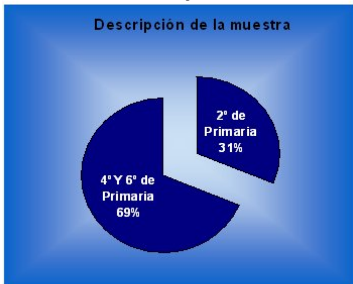
Gráfica 1: Descripción de la muestra utilizada por curso.

semiurbanos-rurales). De estos, 119 estaban en el Primer Ciclo de Enseñanza Primaria, 1º o 2º de EGB, de los cuales, 66 eran niños y 50 niñas; 260 niños, 125 niños y 135 niñas en los restantes ciclos de Enseñanza Primaria, es decir, haciendo alguno de los cursos comprendidos entre 3º y 6º de EGB, ambos inclusive (Ver gráfica 1).